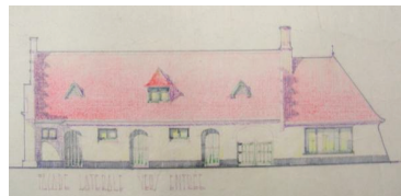
Ontwerptekening van de stalling, naar ontwerp van Dugardyn, 1936

Park. Parkaanleg met kenmerken van 19de of vroeg 20ste-eeuwse landschappelijke vormgeving met resterende parkvijver en vervallen brug, solitaire parkbomen (o.m. Ginkgo, Varenbeuk, Moerascipres, Ceder en parkboomgroepen (o.m. Bruine beuk, Zomereik, Zilverlinde, ...), dreefrestant, parkbos (o.m. Beuk, Tamme kastanje, Paardenkastanje Amerikaanse eik, Robinia, Es, ...), heestermassieven (o.m. Hazelaar, Rododendron, Hulst, Sneeuwbes en Boerenjasmijn), boshooiland en graslandpartijen onder een licht gemodelleerd reliëf. Uit de voormalige moestuinruimte ten zuiden resteren twee smalle druivenserres, een berghokje en een groentenserre. Ten zuidwesten voormalige schapenstal, thans gebruikt als schoolsecretariaat.