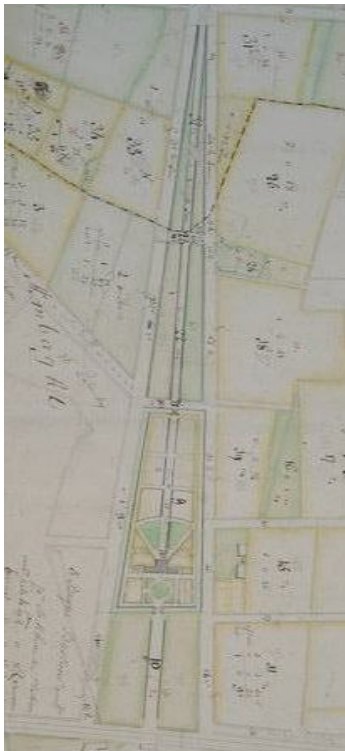
Detail uit de Figuratieve kaart van gronden en bossen, eind 18de eeuw.

17de eeuw. Reeds in de tweede helft van de 17de eeuw wordt op deze locatie een buitengoed vermeld, eigendom van François Lampereel cf. ommeloper van Oostkamp van 1661-1662.